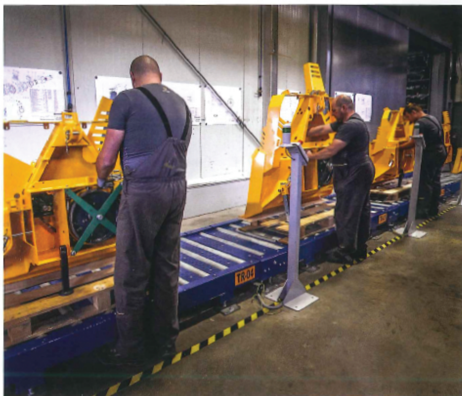
Vse zaposlene spodbujajo k podajanju koristnih predlogov. Lahko gre za tehnološki predlog, konstrukcijsko spremembo, poslovno-procesno spremembo ali pa nekaj čisto inovativnega.

Zakaj so se trajnostne strategije tako resno lotili? »Saj veste, da mladi to pričakujejo,« pravi ustanovitelj. »Izkušnje v kombinaciji z mladostno zagnanostjo in pogledom v prihodnost prinašajo dobre rezultate v podjetništvu, če se pazljivo poslušamo in pravilno slišimo.«