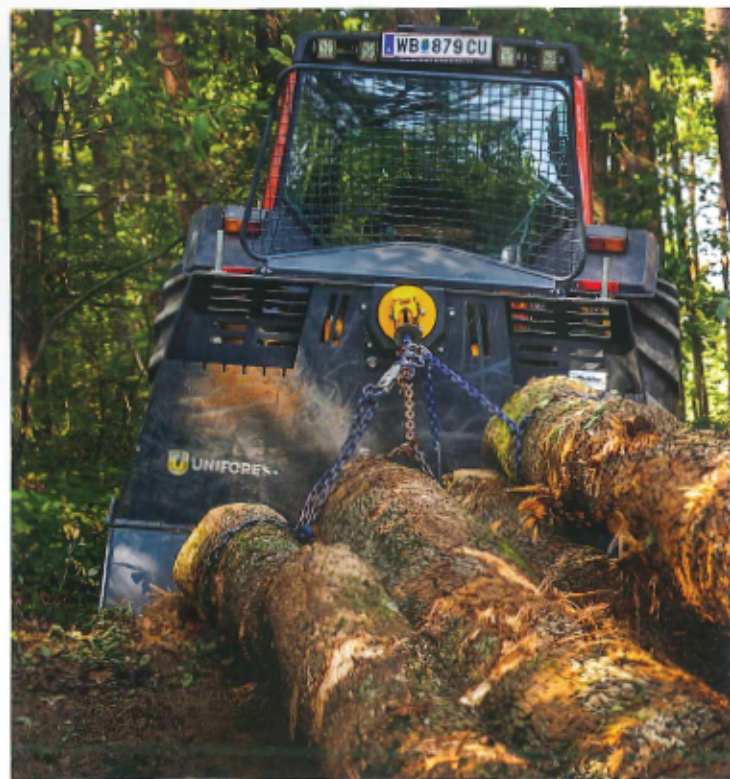
V podjetju so oblikovali novo trajnostno poslovno strategijo ter določili cilje in kazalnike za prihajajoče obdobje, ki ga bodo zaznamovali predvsem hiter tehnološki razvoj, globalne klimatske spremembe in drugi razvojni trendi.